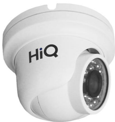
Цветная IP камера HiQ-5020N